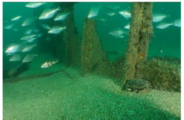
Ce qu'il reste de la coque enfouie sous le sable !!