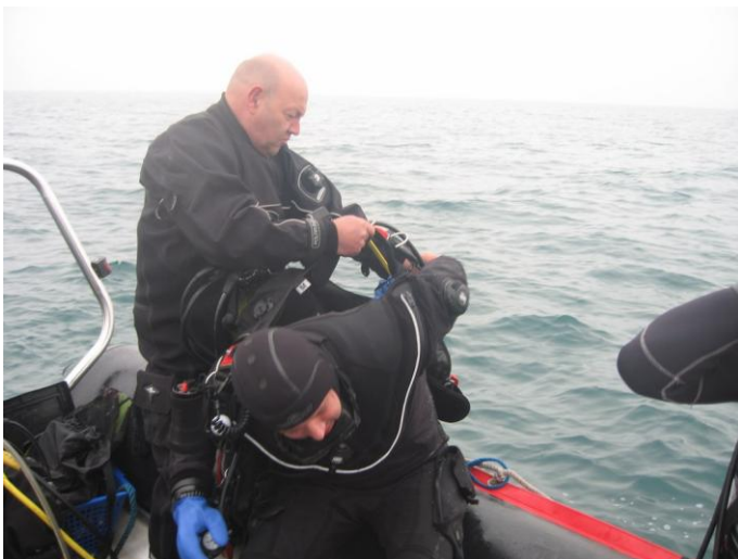
Un MFesse se doit d'aider son prochain...c'est un reflexe !!