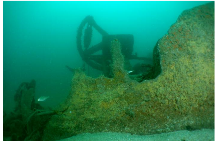
Imaginez la visibilité.... !!!