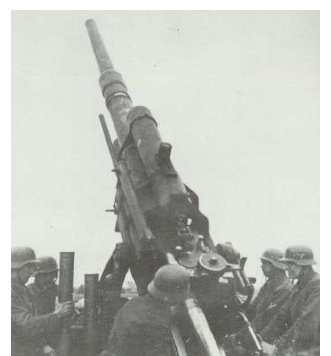
Le canon de "88" a été décliné à toutes les sauces.