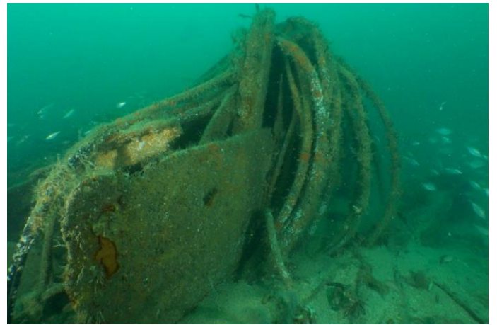
Les câbles servant au déminage