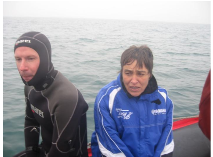
la 1ère dame du GPSC Chauny