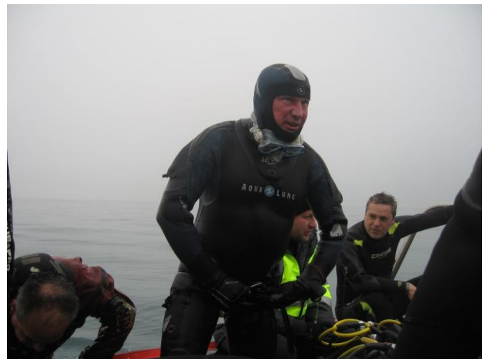
Monsieur le Président du GPSC