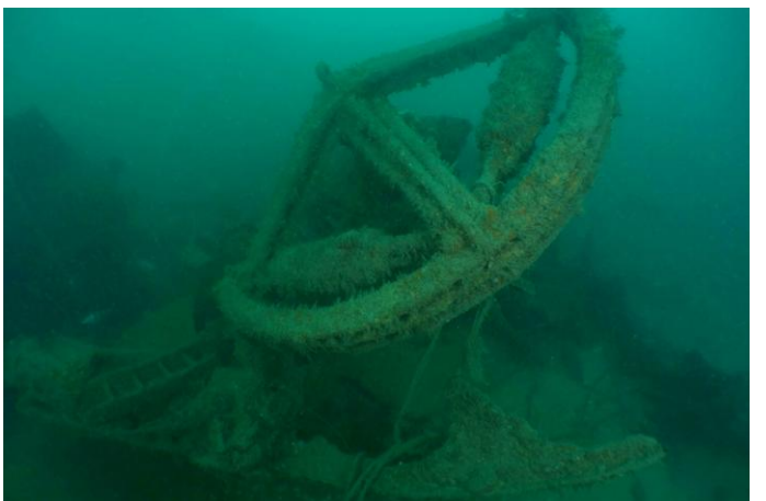
La gueuse est tombée à côté du secteur de barre.