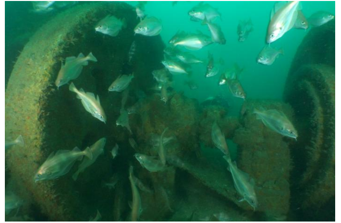
A l'avant du moteur, le générateur d'électricité servant à alimenté les câbles de déminage magnétique.