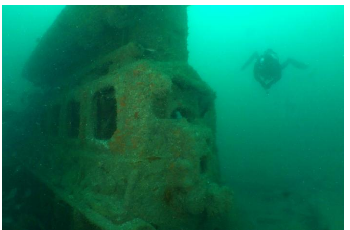
La pièce maitresse du BEIJERLAND...son moteur.