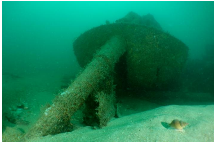
Retour au mouillage ... les bulots arrivent pour se reproduire, l'eau va se rafraichir !!!