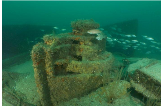
Un treuil au sable en face du « 88 »